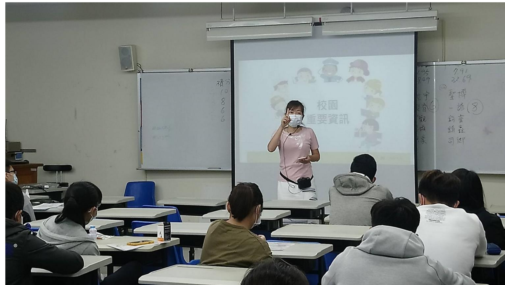
林岑怡老師提醒學生 體大校園內需注意的地段