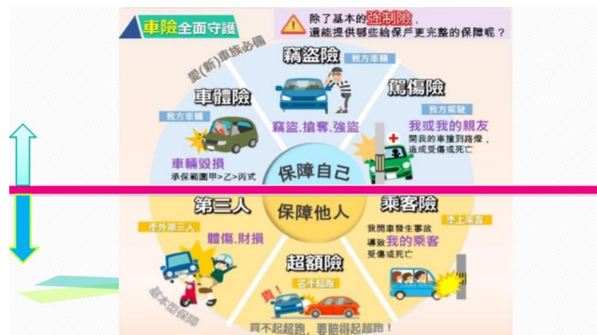
講師介紹車險的種類