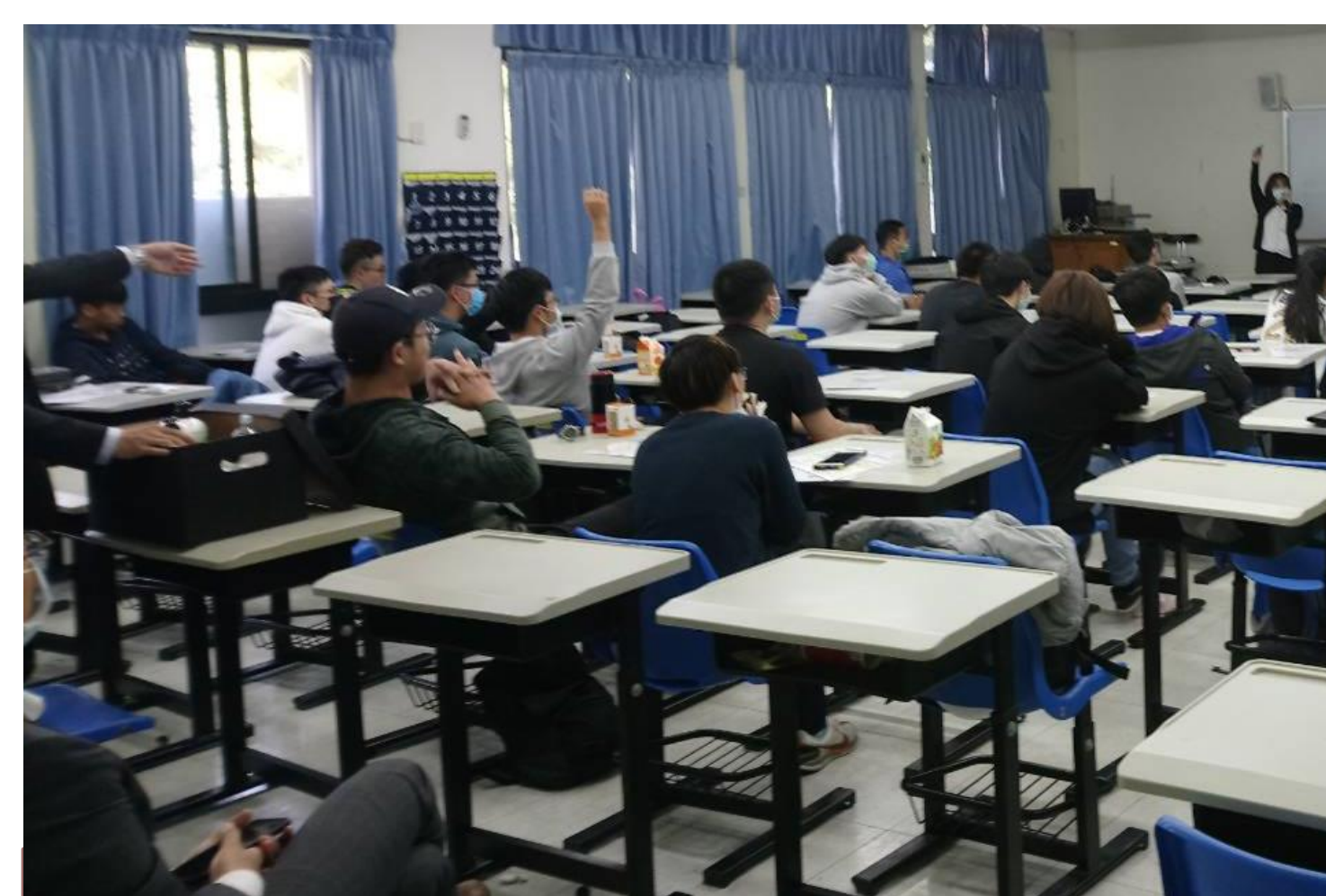
同學踴躍舉手回答問題