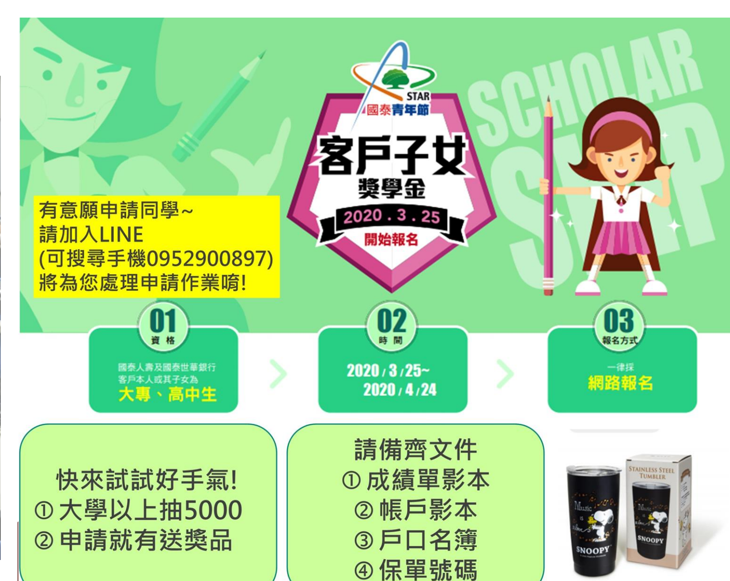
講師宣傳獎學金活動