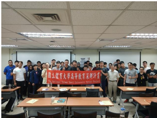
參與學生與威達經營行銷團隊合影