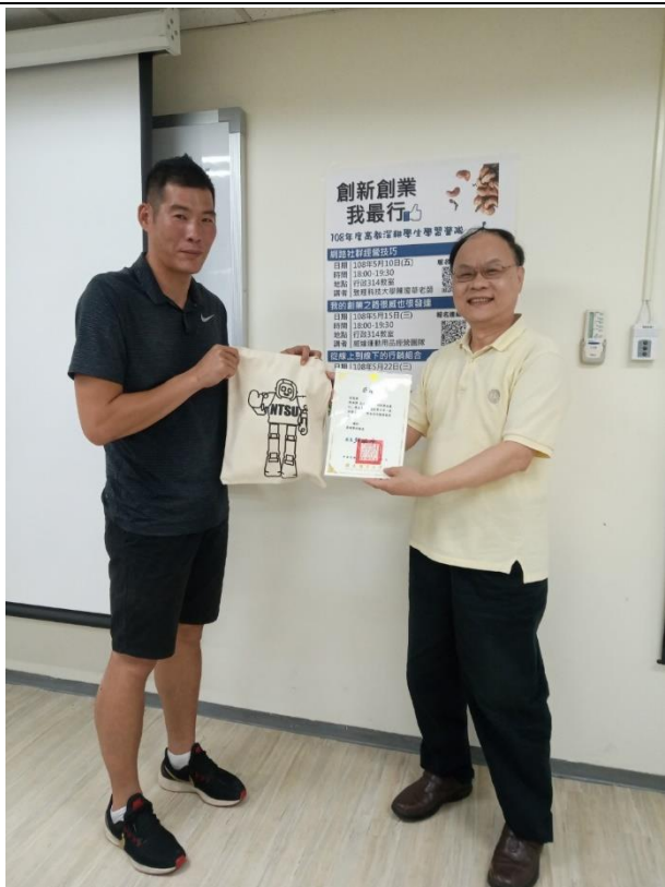
致感謝狀予威達經營行銷團隊