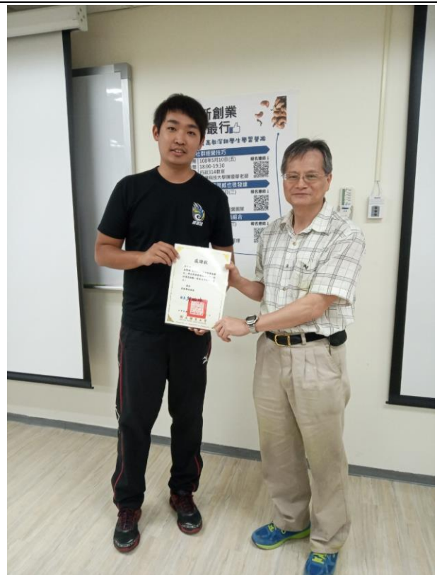
致感謝狀予威達經營行銷團隊