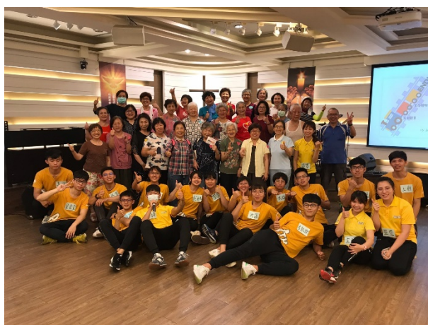
林口愛鄰服務後與社區長輩大合照。