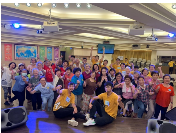
有氧課程帶動中加入合照可愛的動作定格設計。