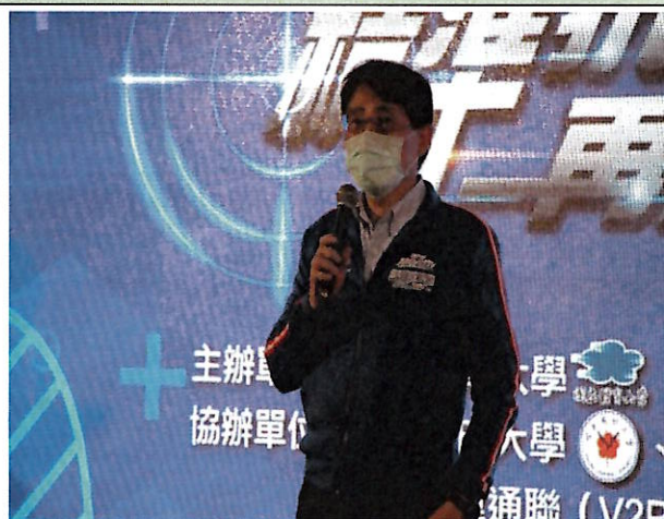
體育署高署長致詞