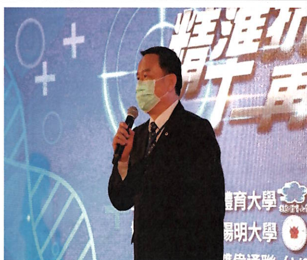
國立體育大學邱校長致詞