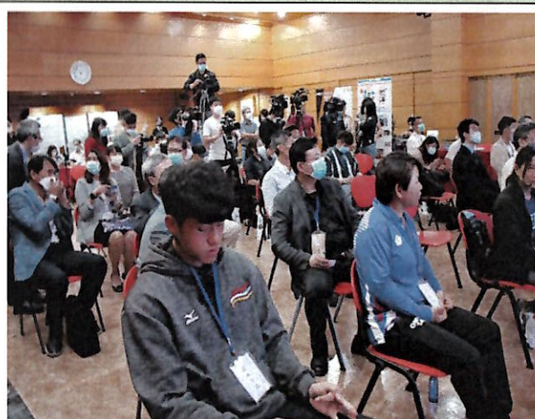
媒體貴賓接待與入座