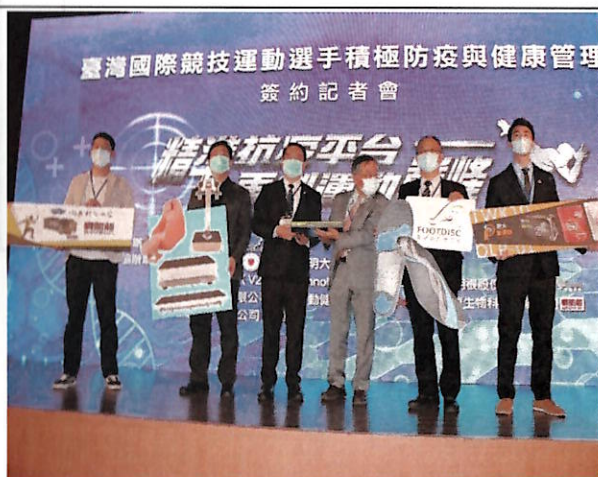
企業贈與計畫物資儀式