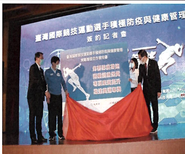
合作意向書揭幕儀式