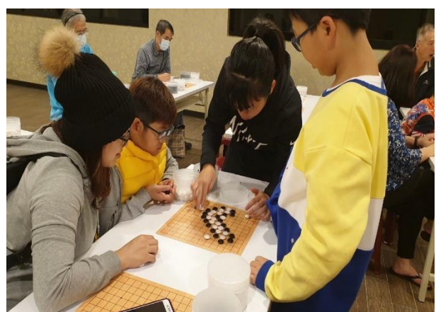
圍棋講師協助學員進行練習