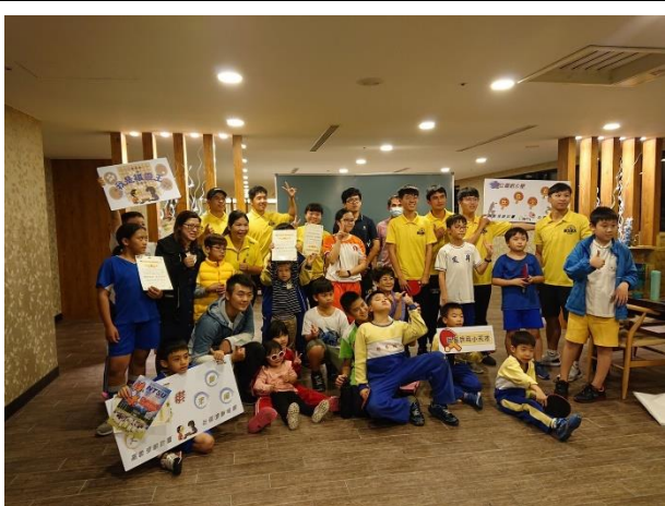
所有參加成員進行大合照！