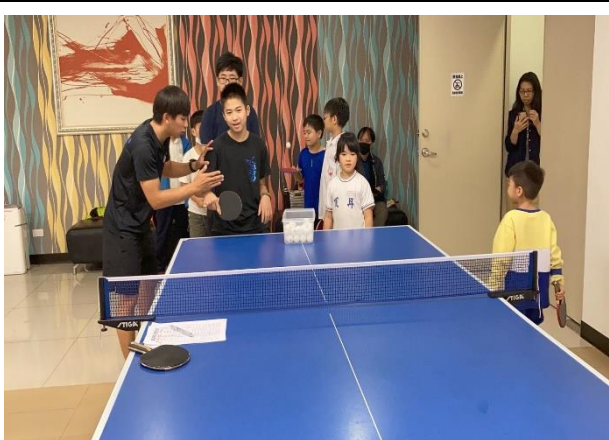
桌球講師協助學員進行練習