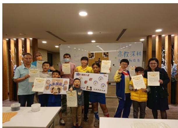
圍棋課程結束大合照