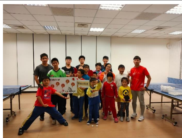
桌球課結束後大合照