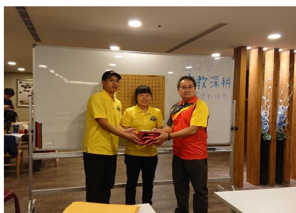
社區主委與體育大學講師合照