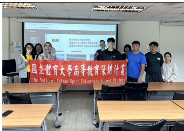
講座結束後大合照