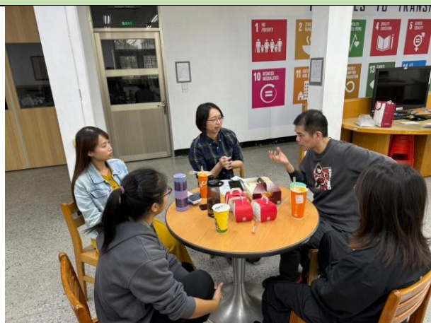
與復旦高中老師討論課程

活動照片最少 6 張，每張需有照片說明，請排列於 A4 版面內，每張 A4 紙張排列直式 4 張或橫式 6 張照片(每張照片長寬比例要一樣，可設定寬度 8CM)。