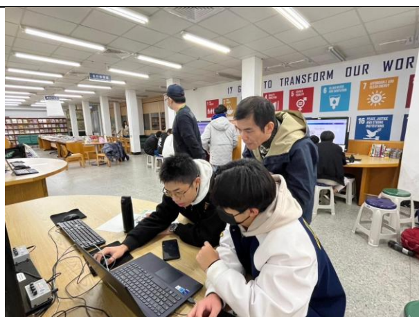
教導學員使用 AI 生圖