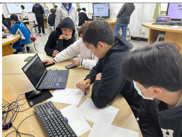
學員實際操作、討論