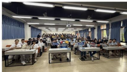
復旦中學師生到國體大

除了限時創作，復旦高中師生也參觀國體大休閒產業經營學系運動傳播組專用攝影棚，瞭解豐富的實作課程、與業界合作的多種實戰內容，以及世大運和奧運等海外實習機會，幫助高中生更了解運動產業與行銷傳播的發展方向。