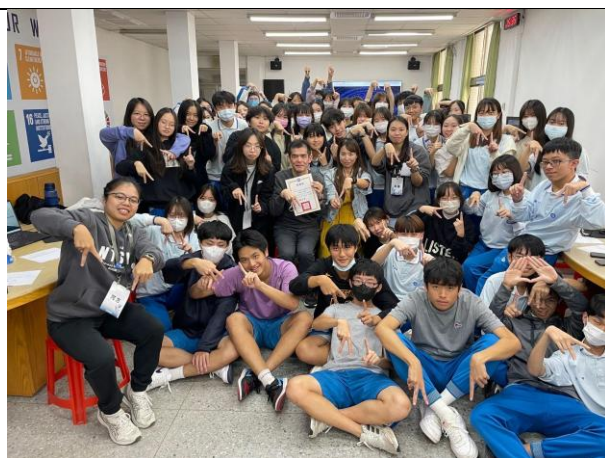
教學人員與復旦師生大合照