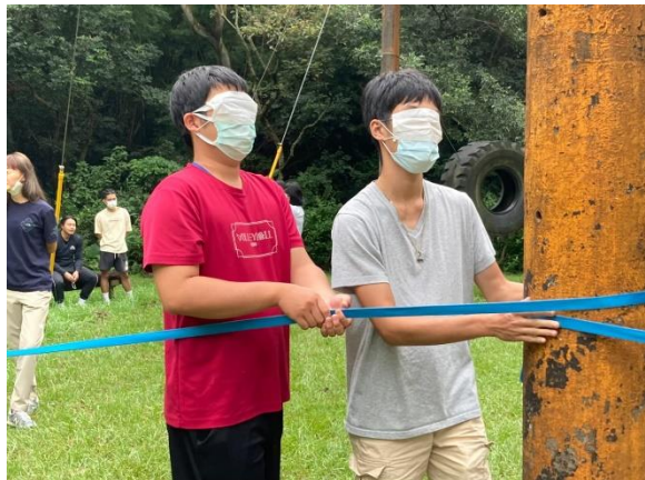
活動體驗以及教案發想