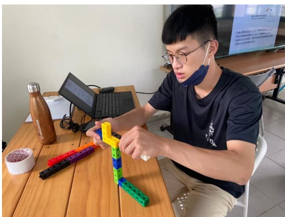
透過活動操作演示實際教學場面