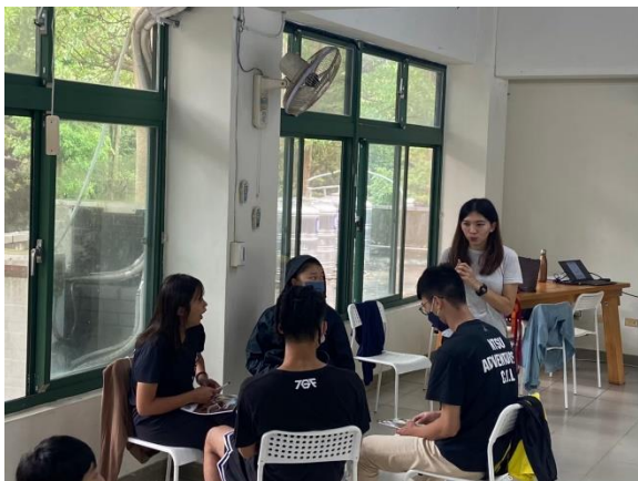
體驗教育基礎理論課程

活動照片最少 6 張，每張需有照片說明，請排列於 A4 版面內，每張 A4 紙張排列直式 4 張或橫式 6 張照片(每張照片長寬比例要一樣，可設定寬度 8CM)。