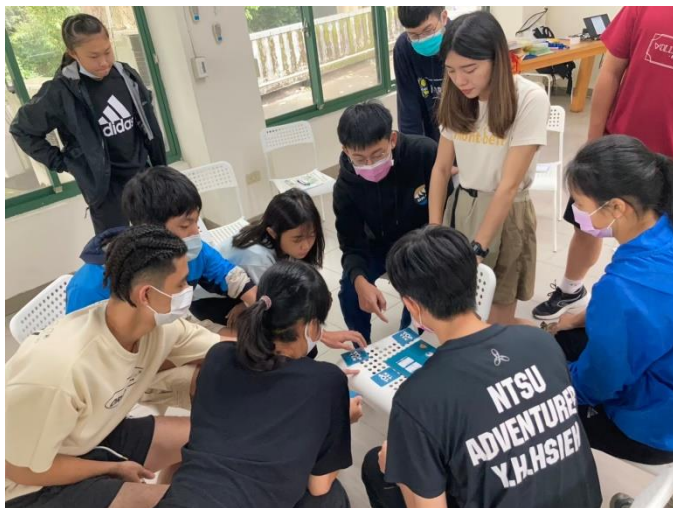
動態反思技巧教學