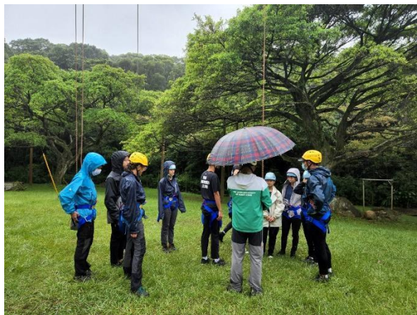
雨中架設及教案實作