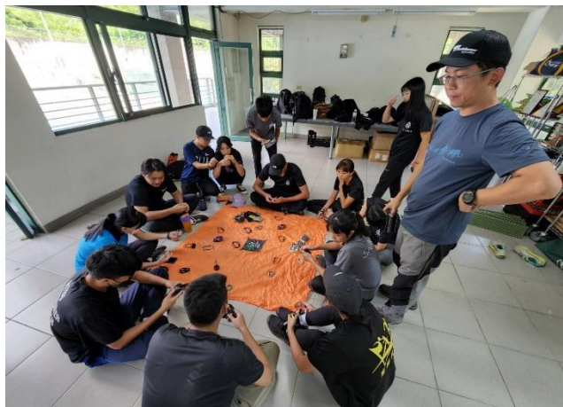
器材認識以及認證制度