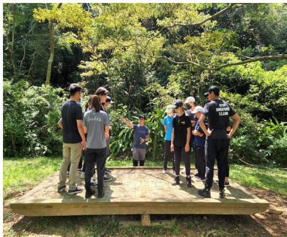
設施體驗以及教案發想