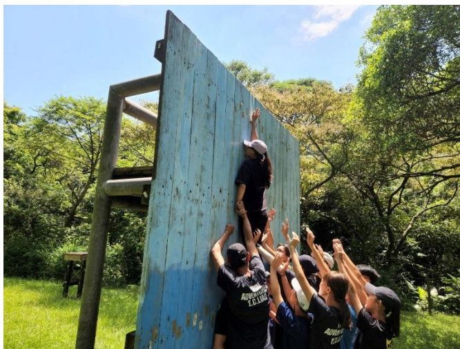
防護教學與教案試教