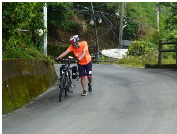
騎不動，只好下來牽車，繼續前行