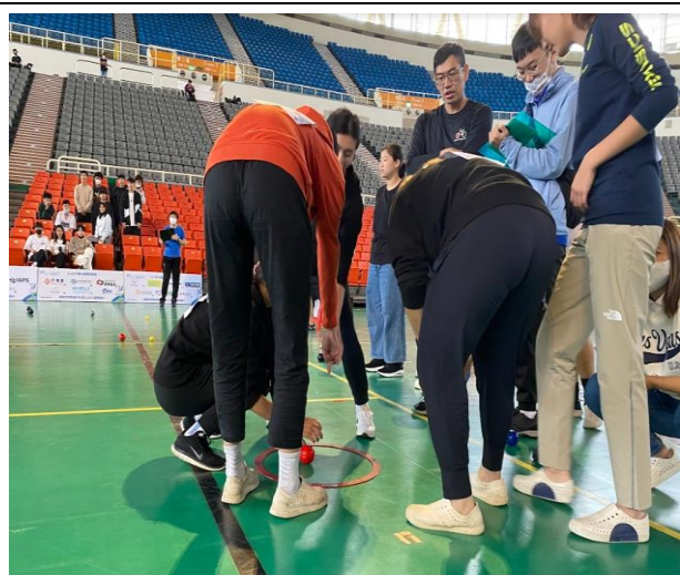
雙方球員討論球距決定哪方擲球