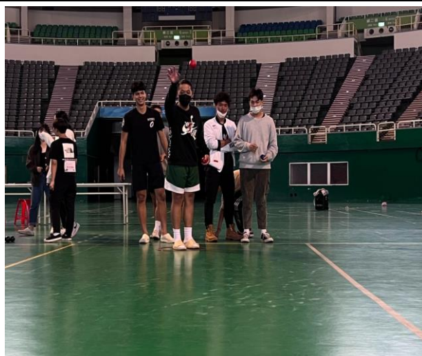
參賽同學認真為比賽暖身