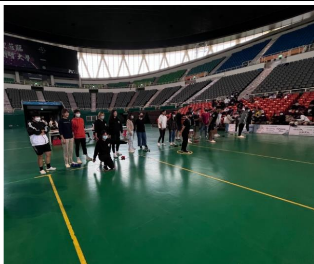
初賽選手為第一輪比賽出戰