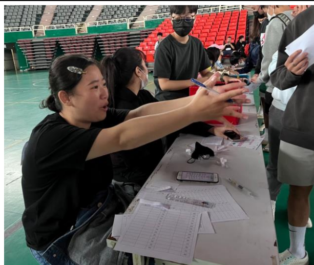
檢錄組同學認真為參賽者填寫資料