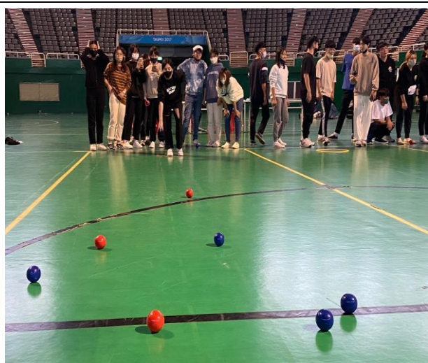
決賽選手為比賽奮鬥的模樣