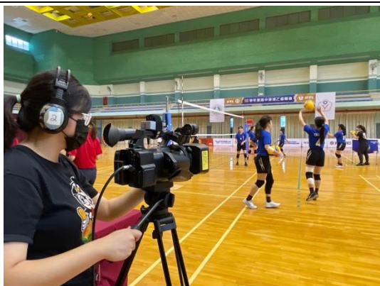
場邊攝影工作畫面