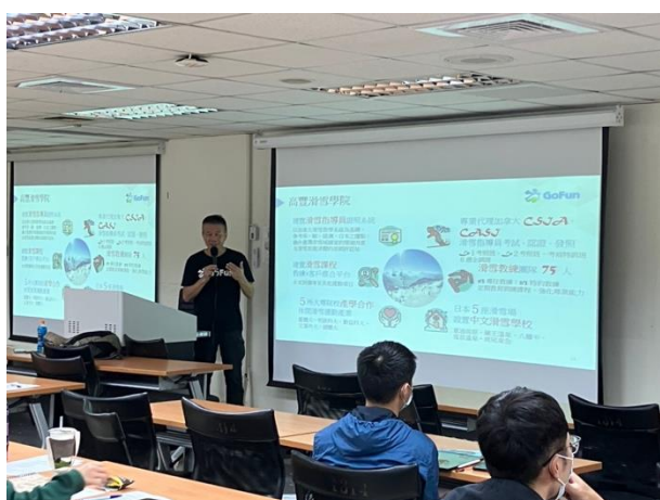
講師介紹台灣滑雪產業