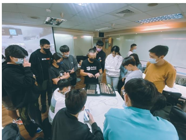
講師示範教學器材