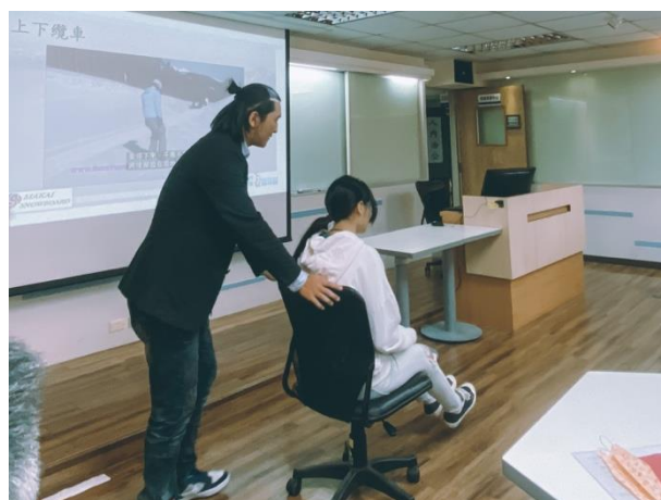
講師示範下纜車動作