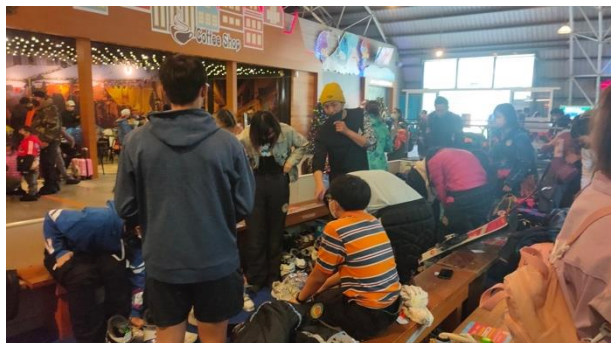
教練介紹裝備穿著

活動照片最少 6 張，每張需有照片說明，請排列於 A4 版面內，每張 A4 紙張排列直式 4 張或橫式 6 張照片(每張照片長寬比例要一樣，可設定寬度 8CM)。