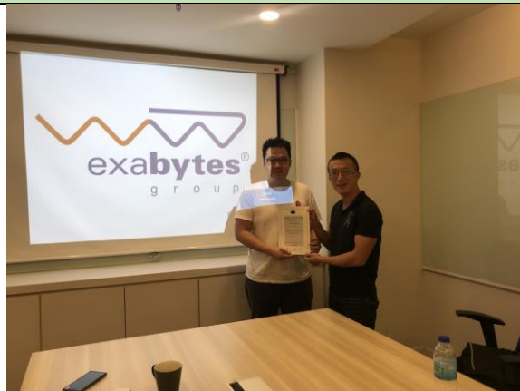
與 easystore, exabytes 老闆合影