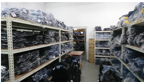
WA Order 倉庫