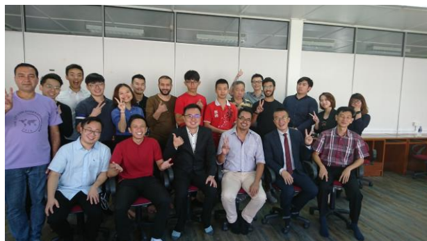
與理工大學教師與同學合影