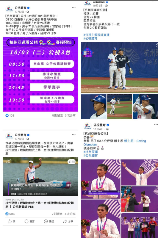
於公視體育FB發布賽事預告、即時賽況、新聞報導、賽事成績等