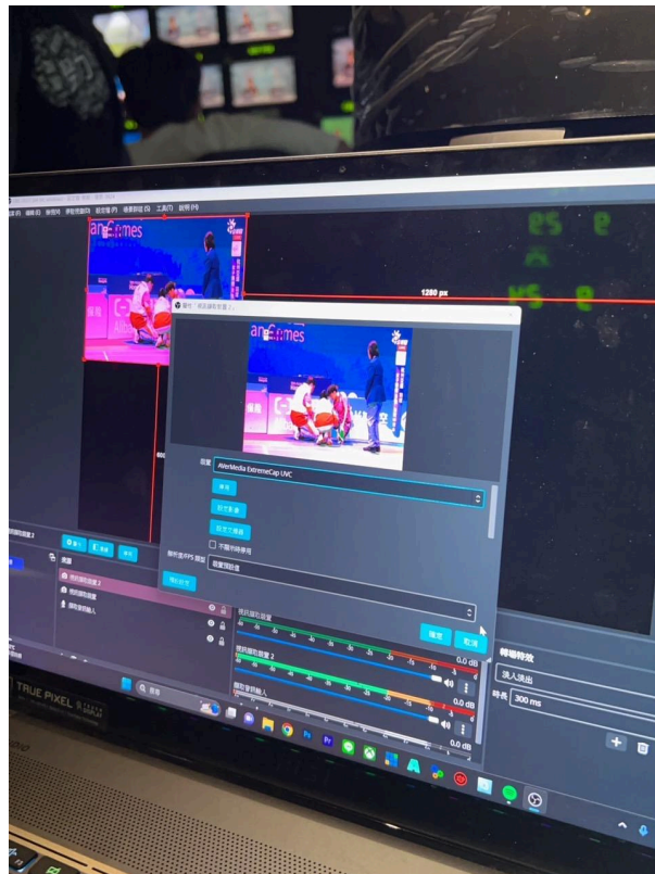
使用電腦OBS軟體錄製、截圖