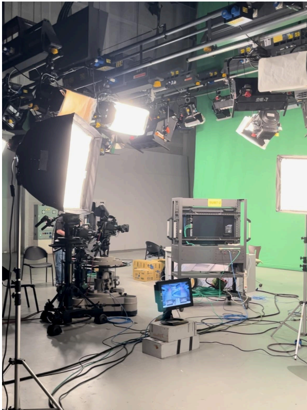
攝影棚參觀—整體樣貌、燈光介紹、主播視角