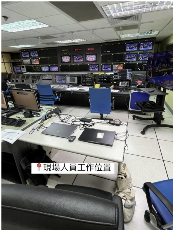
工作區域—公共電視第七棚

活動照片最少6張，每張需有照片說明，請排列於A4版面內，每張A4紙張排列直式4張或橫式6張照片(每張照片長寬比例要一樣，可設定寬度8CM)。