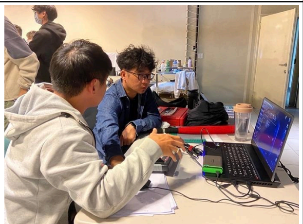
講師確保教學內容的呈現