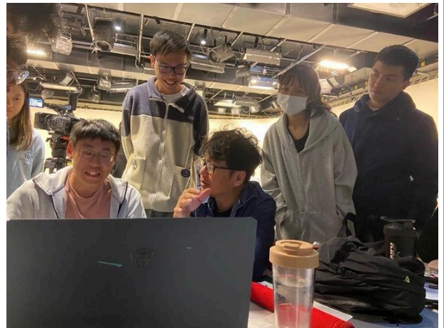
以互動式的教學方式參與討論