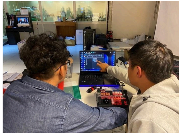
講者與學生進行個別的指導