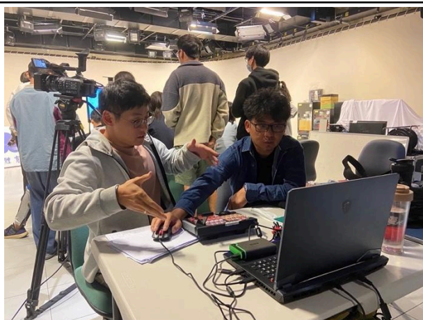
講者收集學生對器材理解上的反饋