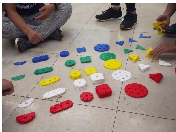
實際進行活動體驗