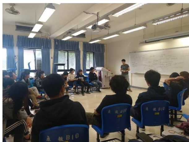
討論自己在引導員路上所面臨的瓶頸

活動照片最少 6 張，每張需有照片說明，請排列於 A4 版面內，每張 A4 紙張排列直式 4 張或橫式 6 張照片(每張照片長寬比例要一樣，可設定寬度 8CM)。