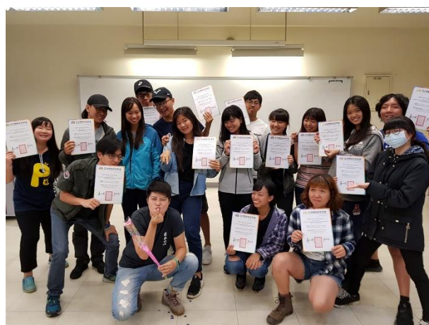
課程結束開心拿著證書與講師合照