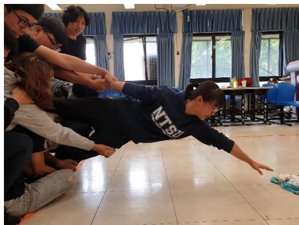
靠著夥伴的支持與自己的勇敢去拿到信物