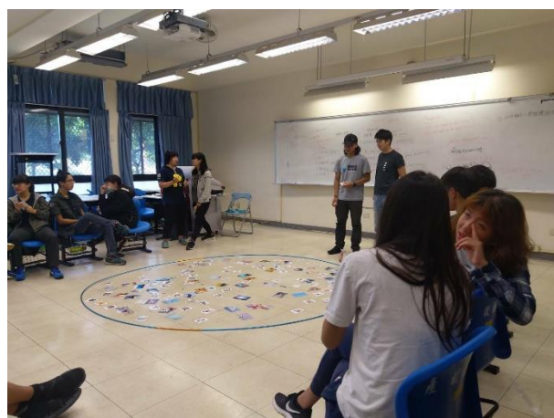
用風景卡與夥伴分享收穫與期待