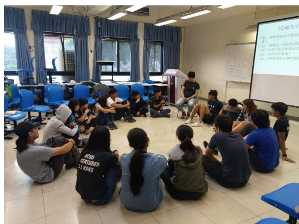
介紹體驗教育基本理論