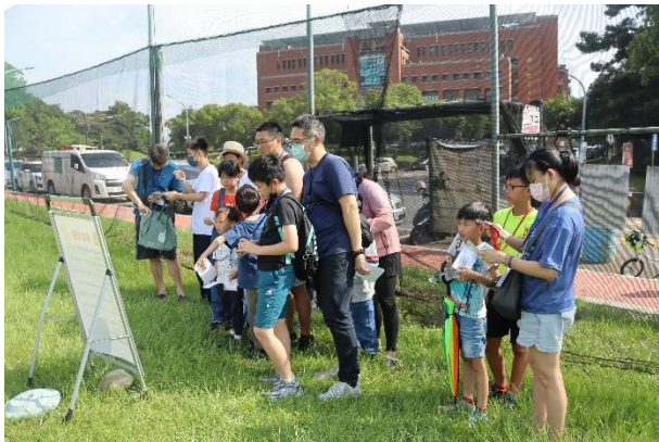
社區參加者觀看漆單安全守則說明