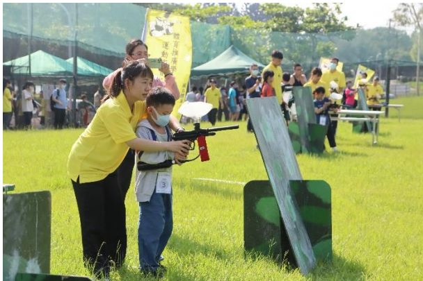
射擊體驗-粽子突擊