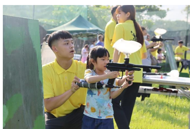
射擊體驗-彩龍射擊