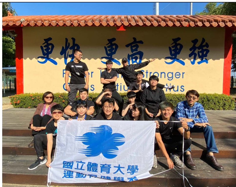
照片說明：國家運動訓練中心的精神指標