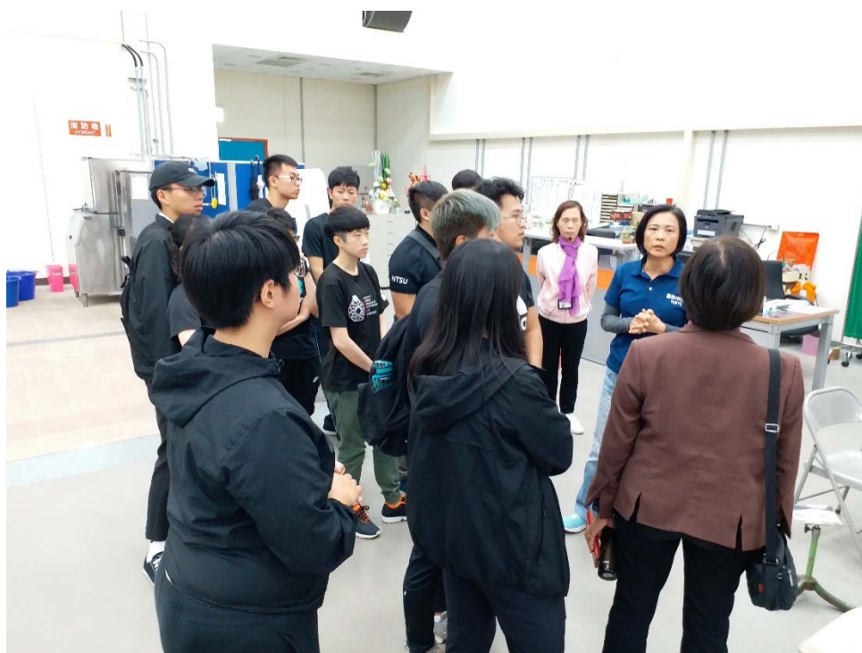
照片說明：國家運動訓練中心的運動防護員協助回答學生參訪問題