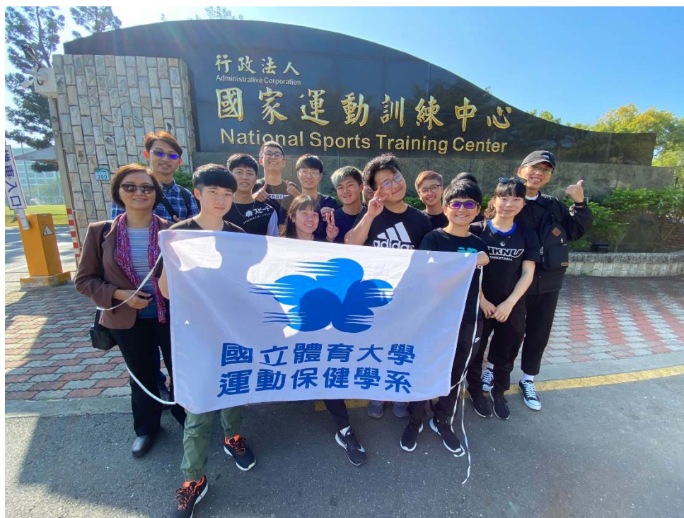
照片說明：國家運動訓練中心前所有人的合影