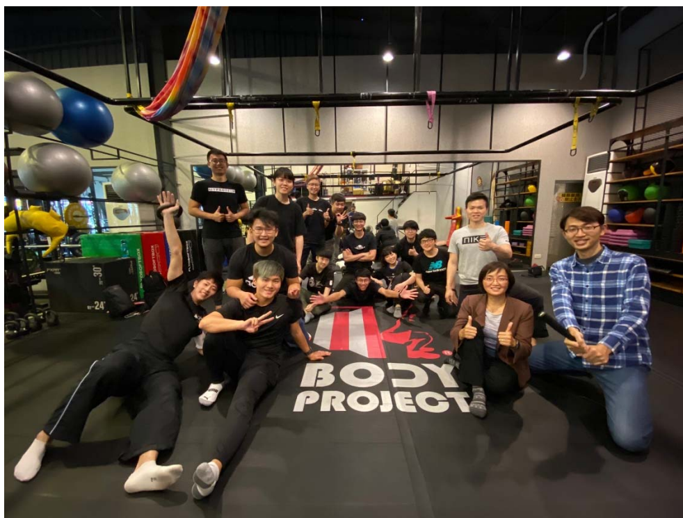
照片說明：OK Body project的店長與師生合影