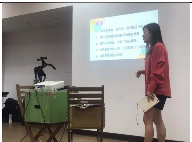
講師進行結論說明