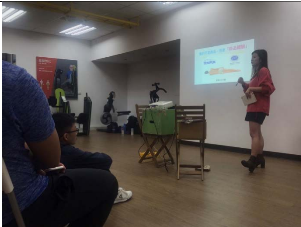
講師說明賣的不是商品，而是商品體驗