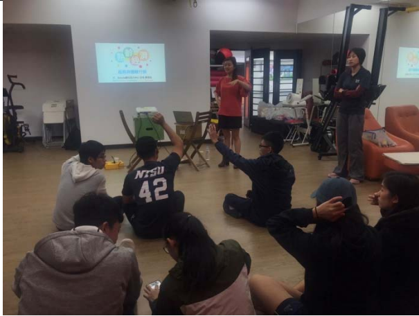
開場，湯院長介紹講師

活動照片最少6張，每張需有照片說明，請排列於 A4版面內，每張 A4紙張排列直式4張或橫式6張照片(每張照片長寬比例要一樣，可設定寬度8CM)。