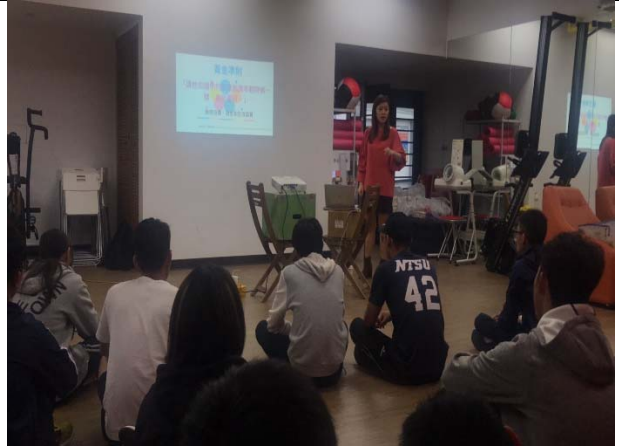
講師說明黃金準則