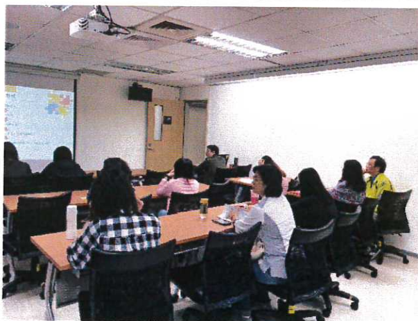
與會主管及教職員