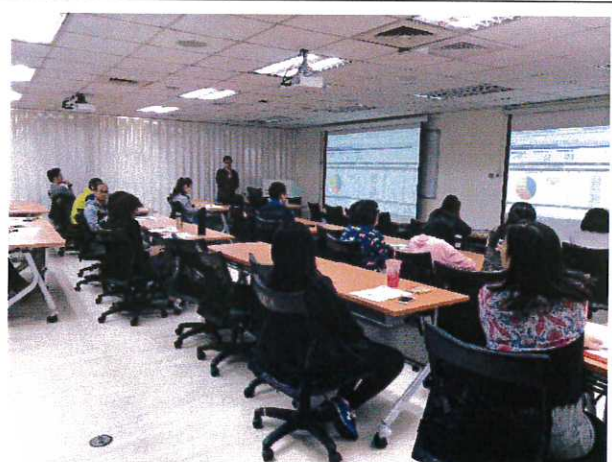
與會主管及教職員