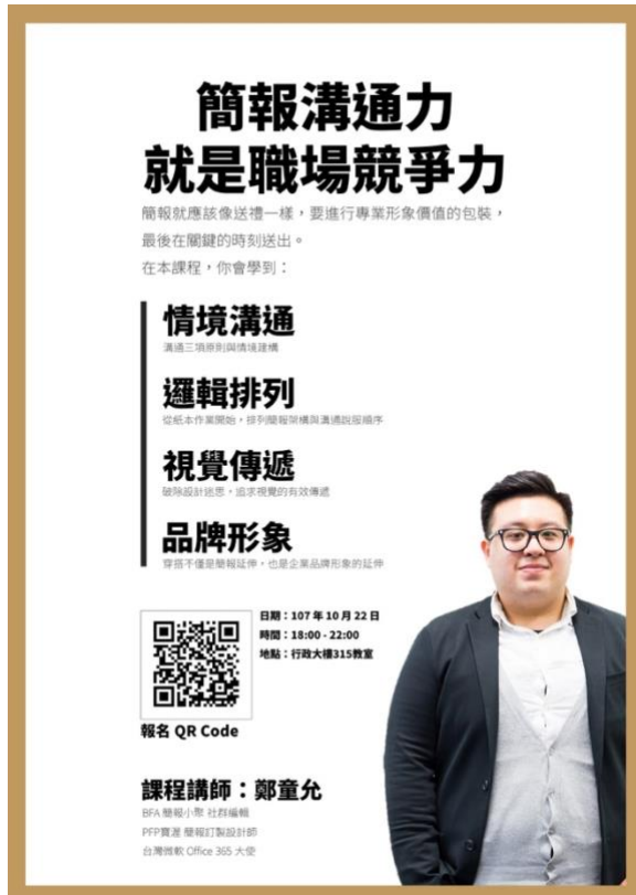
簡報溝通力工作坊 宣傳海報