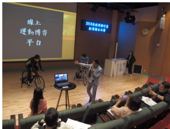
【創業擂台賽決賽】各組卯足全力於決賽呈現創業計畫及試驗結果。