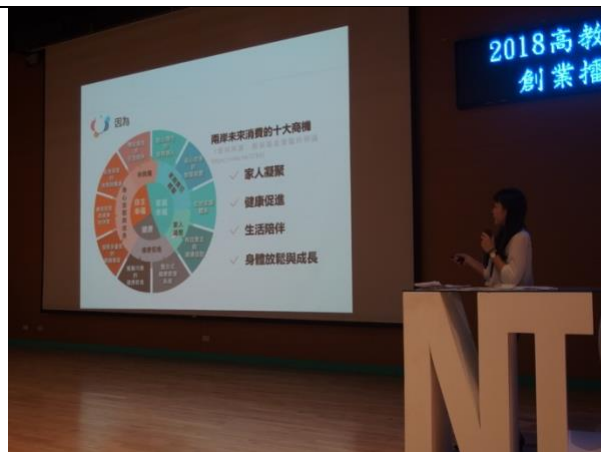
【創業擂台賽決賽】經過兩次簡報工作坊指導安排後，參賽隊伍於簡報技巧上有顯著的進步。