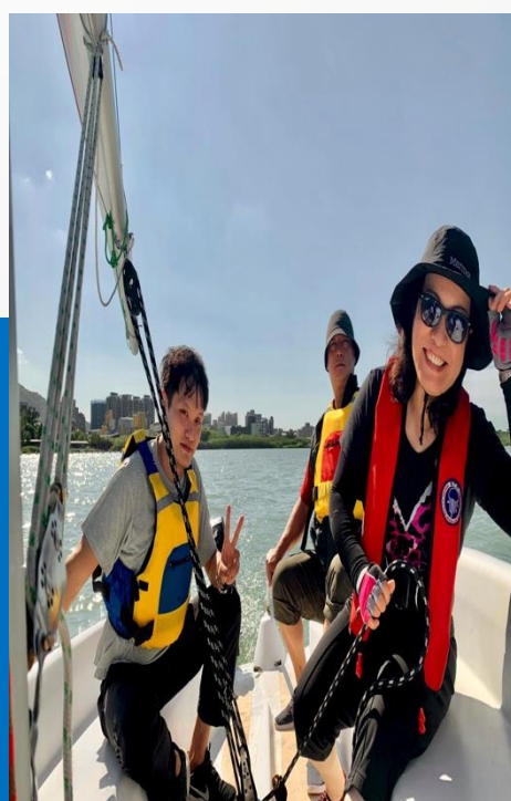
高教深耕計畫B1-2調整