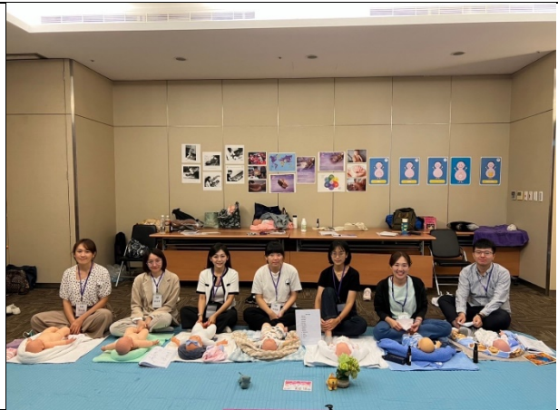
試教小組團體合照