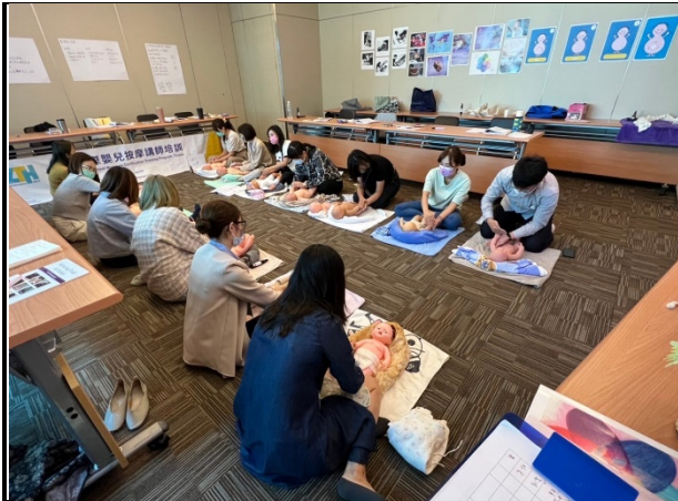
嬰幼兒按摩實作練習-親子教學