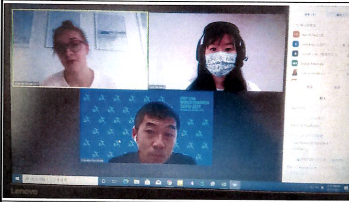
線上視訊研討會- 個人口頭發表