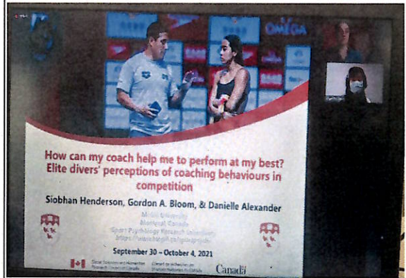
線上視訊研討會- 個人口頭發表