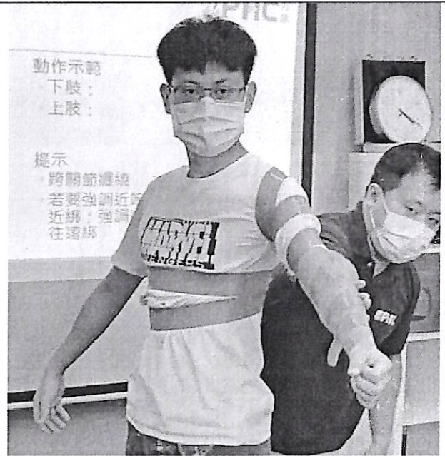
使用整合鬆動療法於動作整合之應用示範