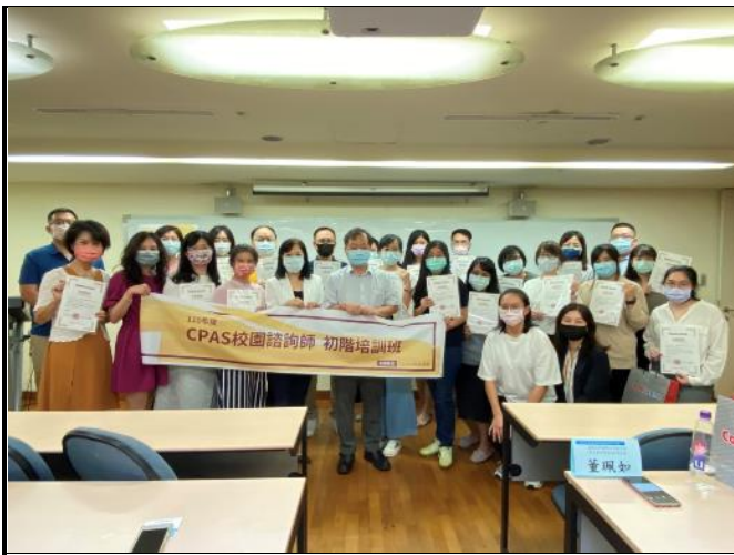
0824 結業測驗與輔導個案簡報