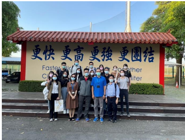
國訓中心地標團照

活動照片最少 6 張，每張需有照片說明，請排列於 A4 版面內，每張 A4 紙張排列直式 4 張或橫式 6 張照片(每張照片長寬比例要一樣，可設定寬度 8CM)。