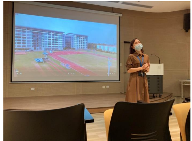
影片講解國訓中心運作