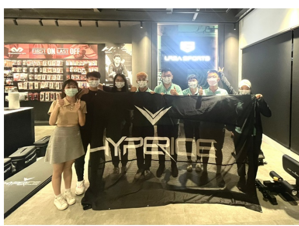
於有熊運動股份有限公司體驗區合影