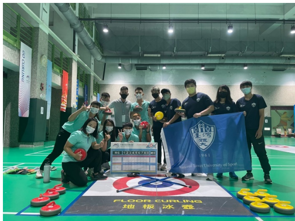
國體大冰石壺大專盃全體合影