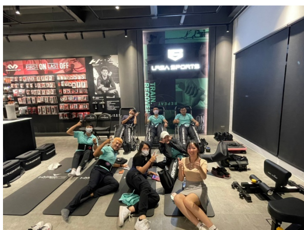
部分成員於運動放鬆區合影