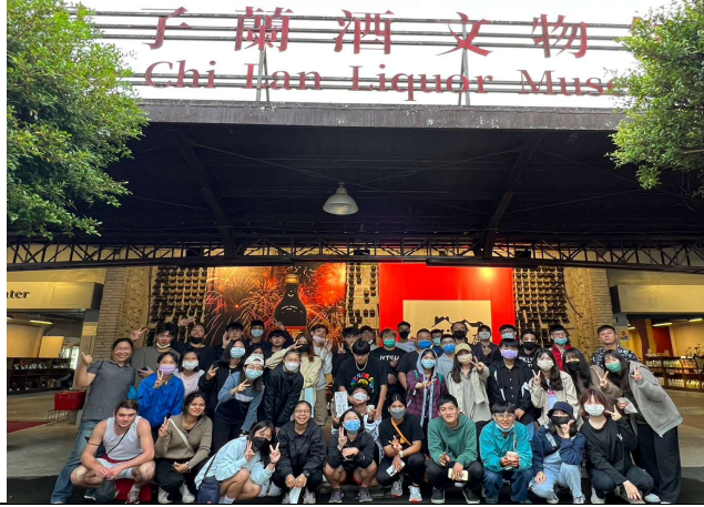
參訪人員於宜蘭酒廠文物館合影