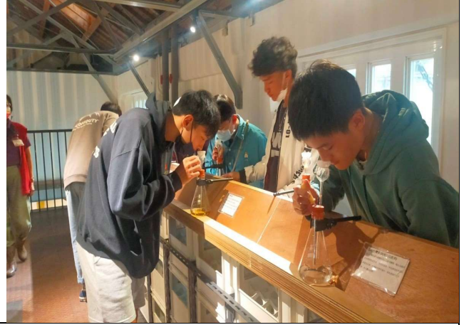
品嚐酒香、百年威士忌、比利時愛爾啤酒