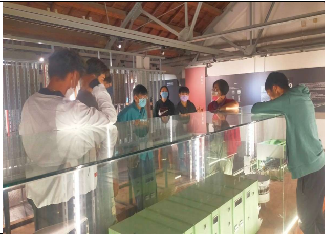
介紹宜蘭酒廠歷年來歷經時代變革