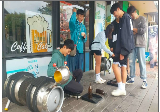
在體驗酒廠旁復古小遊戲