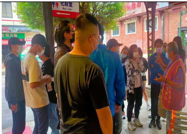
解說酒廠環境導覽、酒品介紹