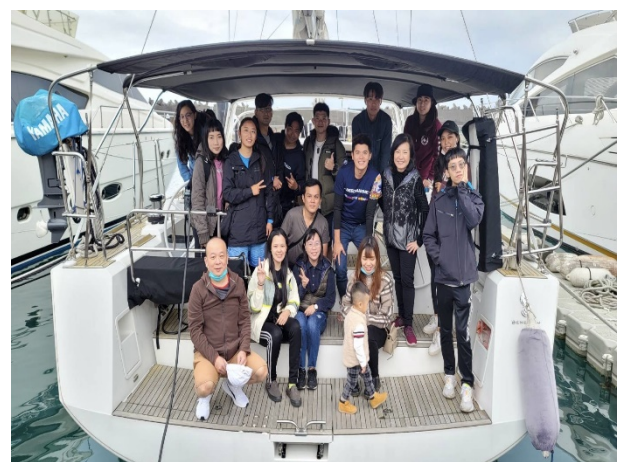
在海洋種子管理帆船上的大合照