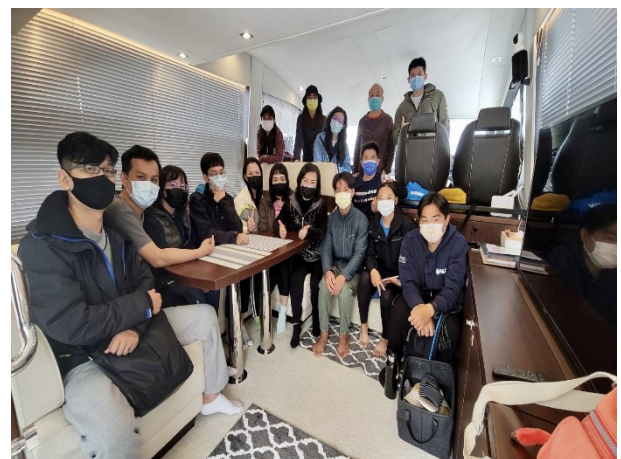
豪華遊艇參觀大合照