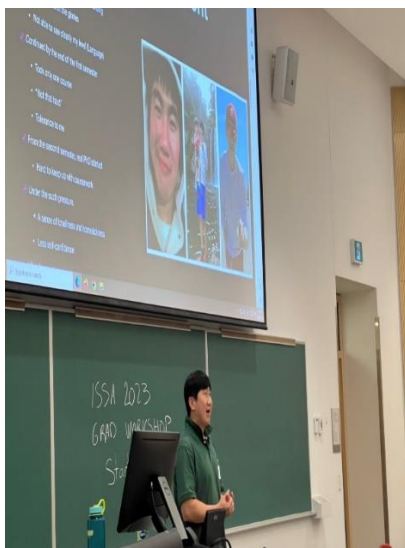
專題演講之學者分享其研究