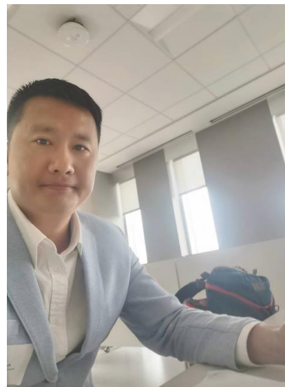
本人口試發表準備中