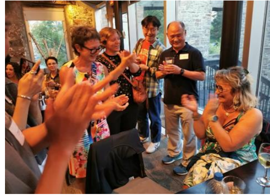
與會學者互相交流時間