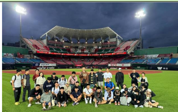
球賽開打前，與味全龍主場天母棒球場合影

活動照片最少 6 張，每張需有照片說明，請排列於 A4 版面內，每張 A4 紙張排列直式 4 張或橫式 6 張照片(每張照片長寬比例要一樣，可設定寬度 8CM)。