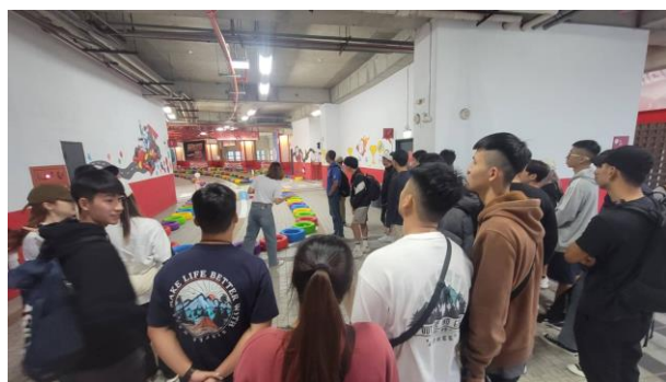
工作人員說明當天場邊活動的遊戲主題及規則