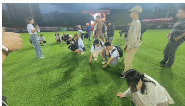
球賽開打前，工作人員講解棒球場的功能與場地的材質